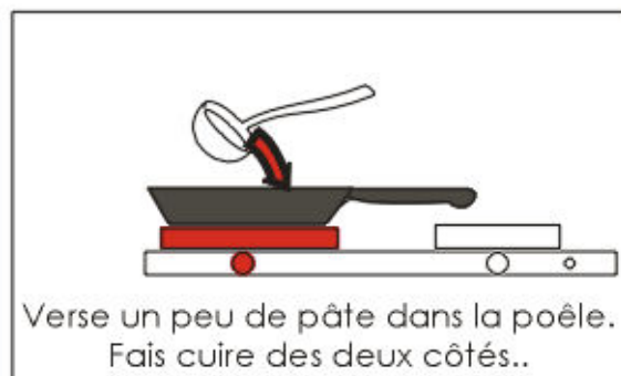
Verse un peu de pâte dans la poêle. Fais cuire des deux côtés..